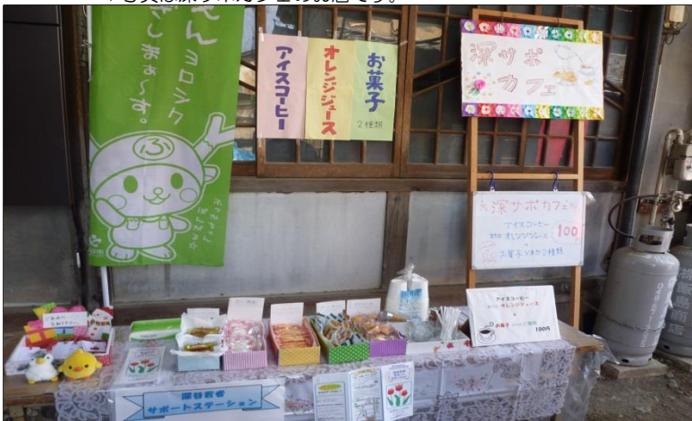
▽写真は深サポカフェのお店です。

参加メンバーは暑い中お客様に笑顔で対応し、とても頑張っていました。当日ボランティアで駆けつけてくれたり、差し入れを持って買いに来てくれた利用者さんもありました。私はFMふっかちゃんに生出演し、サポステのPRをしました。利用者の皆さんとスタッフにとつて、とてもいい経験になりました。Yより